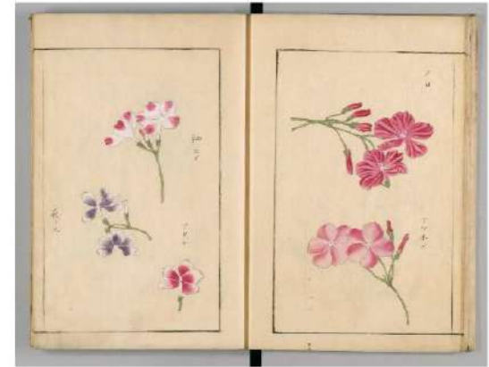
▲『桜草写真』,写.

野に咲く花をめぐるのと並行して、手元で育てる園芸品種としても楽しまれていました。最初は原野で珍しい色の花を探し歩いていたようですが、やがてタネを採り、苗から育てることが工夫され、様々な色や形の花が生まれるようになりました。左の本は手書きの花の記録で、作者も書かれた年もわからないのですが、冒頭に三百余ある種類の内、「上花」六十五品を写したとあります。