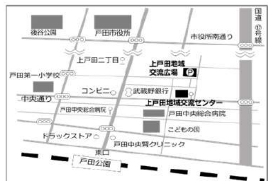
上戸田地域交流センター・戸田市立図書館上戸田分館 「PALDISE」4月号(毎月1日発行)

発行/〒335-0022 埼玉県戸田市上戸田 2-21-1 上戸田地域交流センター TEL 048-229-3133 FAX 048-229-3996 Mail kamitoda7kouryu@ipal-friendship.net 戸田市立図書館上戸田分館 TEL 048-442-1211 FAX 048-229-3824 Mail kamitoda7toshokan@ipal-friendship.net 責任/フレンドシップ上戸田共同事業体