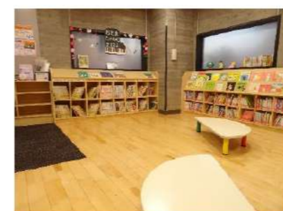
▲左窓側の棚の上段は季節ごとに替わる展示コーナー。下段は紙芝居等があります。

入口のドアは、歩き回る子がお部屋から出てしまう時や、絵本の読み聞かせをする時など、必要に応じて閉じてご利用いただけます(カギはかけられません)。