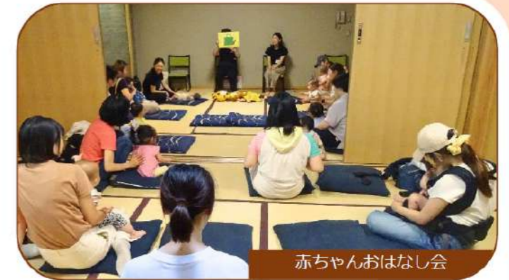
赤ちゃんおはなし会

上戸田分館のおはなし会をまとめてご紹介！ 隣の8ページで、今月のテーマ等を掲載しています。 初めての方も、お気軽にお越しください♪ ※会場は、当日あいりし入口に掲示します。