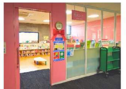
▲入口の前は、ベビーカーを置くスペースがあります。

図書館のカウンター前を通り過ぎると、右側に絵本コーナーの入口があります。約2000冊の絵本と紙芝居、絵本雑誌(こどものとも)「かがくのとも」など福音館書店の月刊絵本シリーズ)が並んでいます。