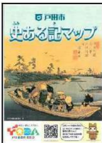
まずは身近なお寺にGO！