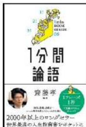
『1分間論語』 齋藤孝／監修 SBクリエイティブ

「ハツとして！GOODカード」とは本の中に書かれている、カッコいい、心揺さぶる、胸に響く、そんなグッとくる言葉やフレーズを紹介するPOPです。グッとくる言葉やフレーズをいくつも持っていれば、カッコいいと思いませんか？それも名刺サイズだからコレクションにもなります。館内でお配りしていますので、皆さんも集めてみませんか？