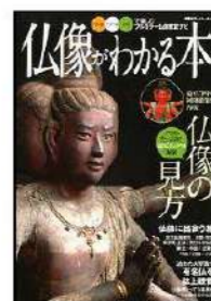
仏像を鑑賞したいGO！