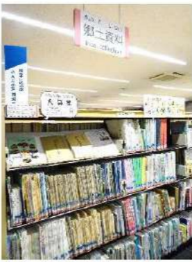
▶新聞棚の奥、「郷土資料」の看板が目印です。

「郷土資料コーナー」では、埼玉県や戸田市の歴史についての書籍だけでなく、戸田市に所縁のある人物の資料や、戸田市に住んでいる人が書いた書籍、市議会資料など多くの資料を保管しています。