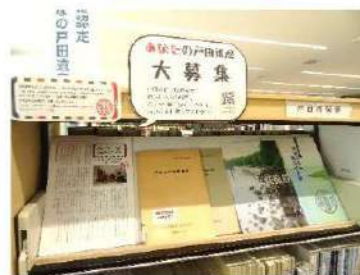
▲『PALDISSE』連載記事「勝手に認定 みんなの戸田遺産」も紹介中。

多くの資料は貴重であるため、館内閲覧となっております。中には貸出ができるものもあります。遺された価値のある地域資料を、図書館は大切に保存し、提供しています。ぜひ手に取ってみてください。