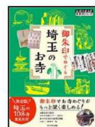
御朱印を頂きたいGO！

遠くへ旅行しなくても、日常から離れて雄大な歴史を感じるのにぴったり。春のお散歩に、史跡巡りをお楽しみください。