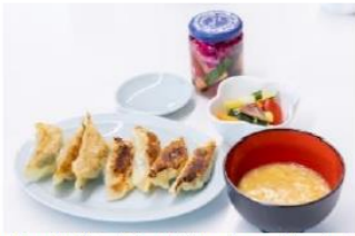
写真は6月の講座で参加者がはじめて作った餃子です