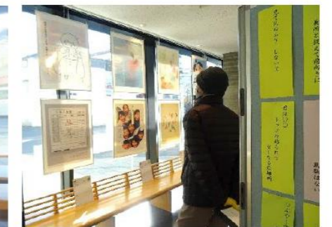
※写真は昨年度のものです