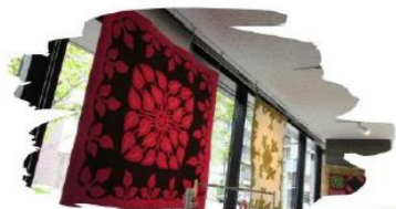
ハワイアンキルトの展示も!