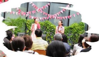
キッチンカーの出店や ハワイアン小物の販売