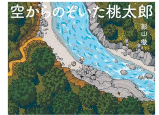
▲『空からのぞいた桃太郎』影山徹／作・絵 岩崎書店

◀『桃太郎は盗人なのか？—「桃太郎」から考える鬼の正体—』 倉持よつば／著 新日本出版社