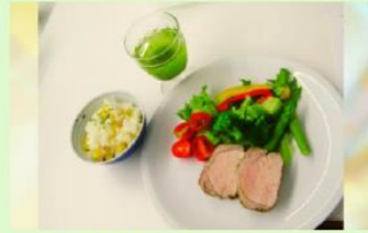
※写真は過去のメニューです

★10月26日(土) ☆9月28日(土) 13:30~16:30 対象：市民の男性 定員：各16人 講師：石田美枝 料金：各2,510円(保険料込) 申込：★9/5(木)~ ☆受付中