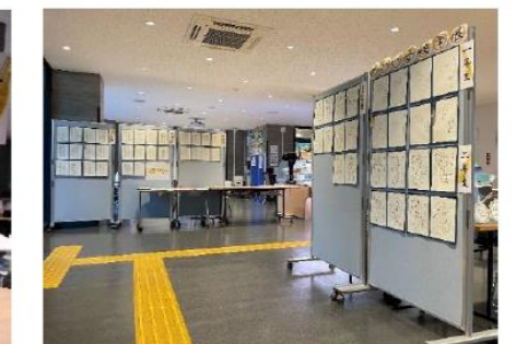
※写真は昨年度のものです