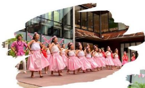
フラダンス発表ももちろん

今年も カネフラ(男性フラ) の 団員も参加します! 最後は みんなと一緒に フラを踊ろう!